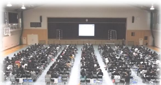
資料配付(進路決定の流れや学校情報)

たとえば、提出物ひとつとっても「プリントを無くしました」「提出しなくても何とかなる」など甘